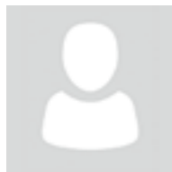
N.N. Zuständige Stelle Ausbildungsberatung